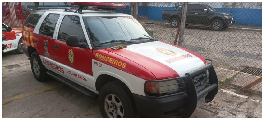
Viatura Blazer VS-02