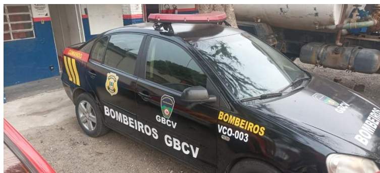
Viatura Polo VCO-003

Cedida pela Prefeitura Municipal mas totalmente adesivada e mantida pelo GBCV