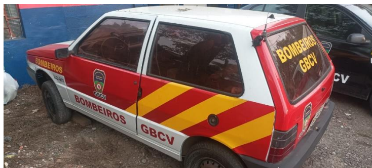
Viatura UNO VO-001