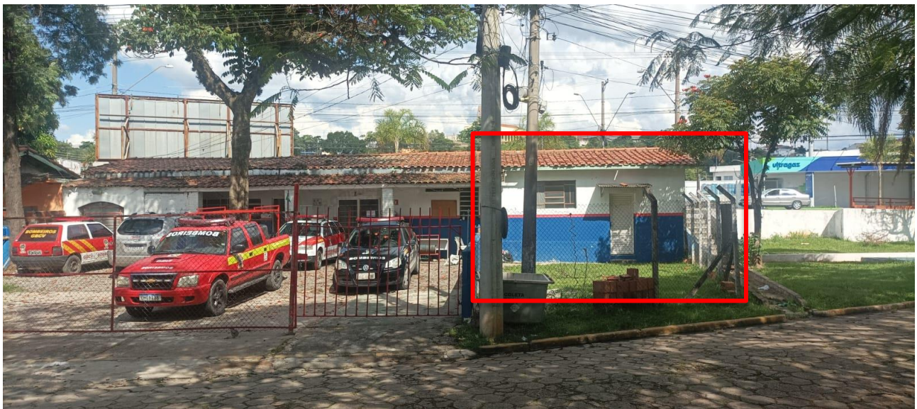
Área para expansão da base dos bombeiros voluntários

SITUAÇÃO: há uma sala no prédio que utilizamos que não está em uso e se fosse cedida para nós permitira ampliar nosso alojamento fazendo com que mais pessoas pudessem utilizar a base.