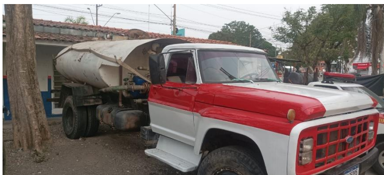
Futuro Caminhão de Combate a Incêndios