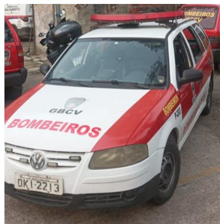
Viatura Parati P-203

Cedida pela Prefeitura Municipal mas totalmente adesivada e mantida pelo GBCV