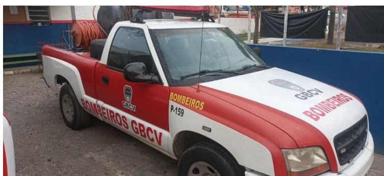
Viatura S-10 P-159

Cedida pela Prefeitura Municipal mas totalmente adesivada e mantida pelo GBCV